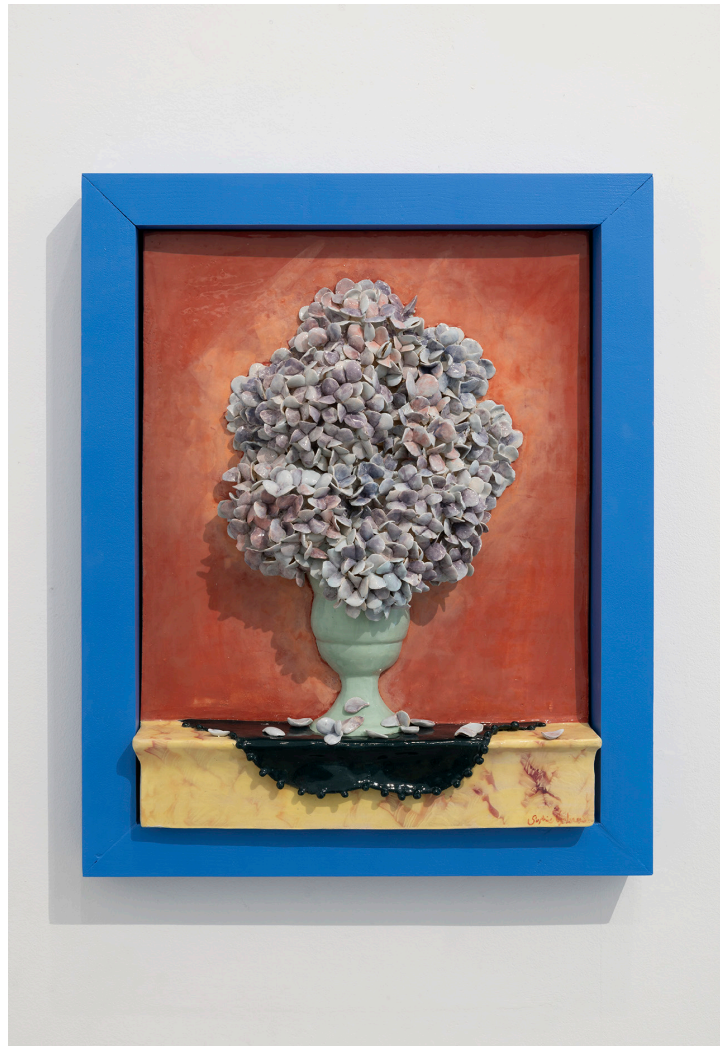
"Hortensias" Gres 1240° 46 x 60 x 8 cm 2026