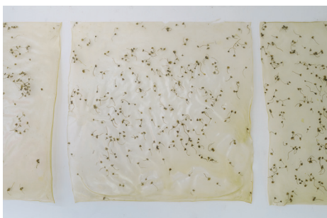
14/04/2022 II Chiribitas, gelatina, glicerina, aceite esencial 90x90 cm. 2022 900 € + IVA