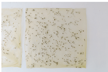
14/04/2022 III Chiribitas, gelatina, glicerina, aceite esencial 90x90 cm. 2022 900 € + IVA