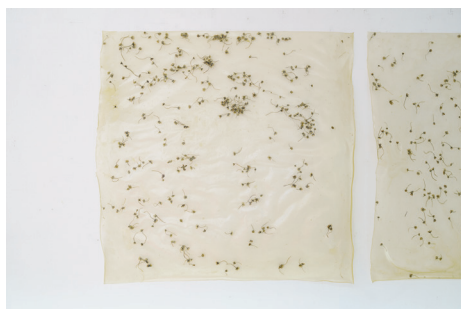
14/04/2022 I Chiribitas, gelatina, glicerina, aceite esencial 90x90 cm. 2022 900 € + IVA