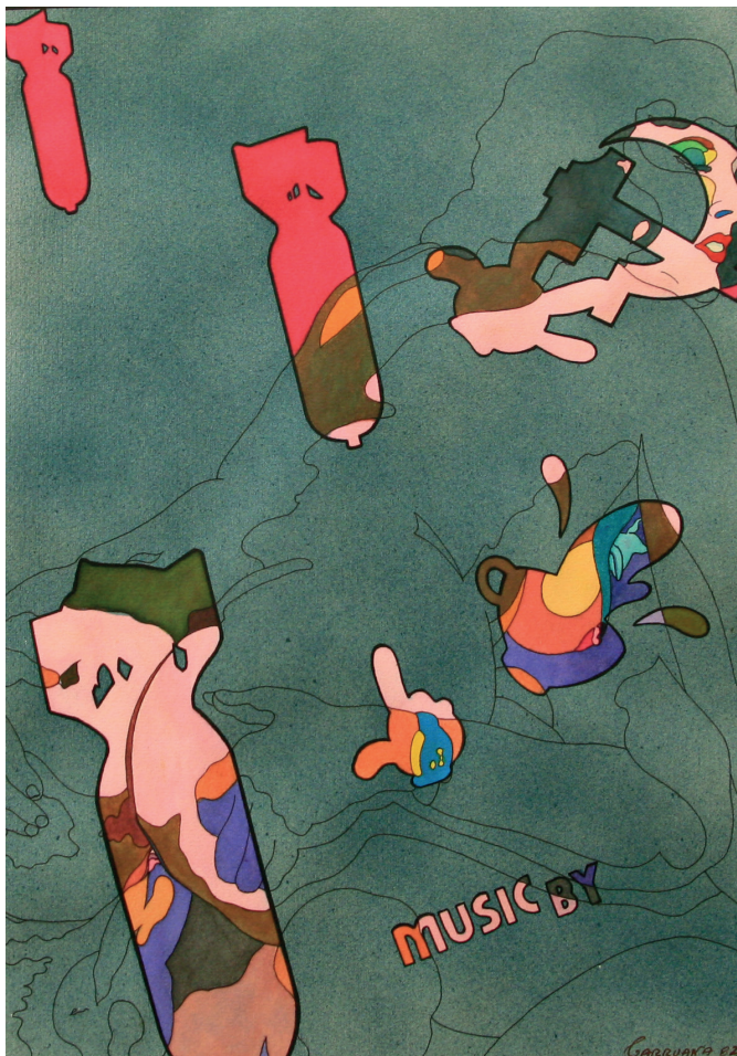
S/T, técnica mixta sobre cartulina, 43 x 33 cm. Jorge Carruana Bances, 1982