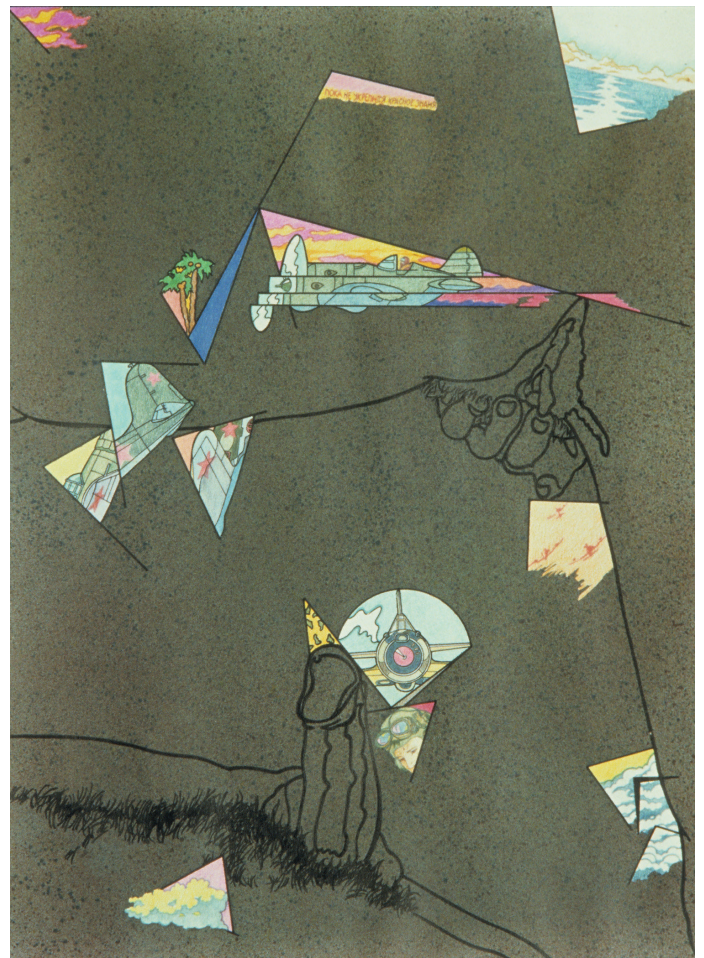
S/T, técnica mixta sobre cartulina, 43 x 33 cm. Jorge Carruana Bances, 1981