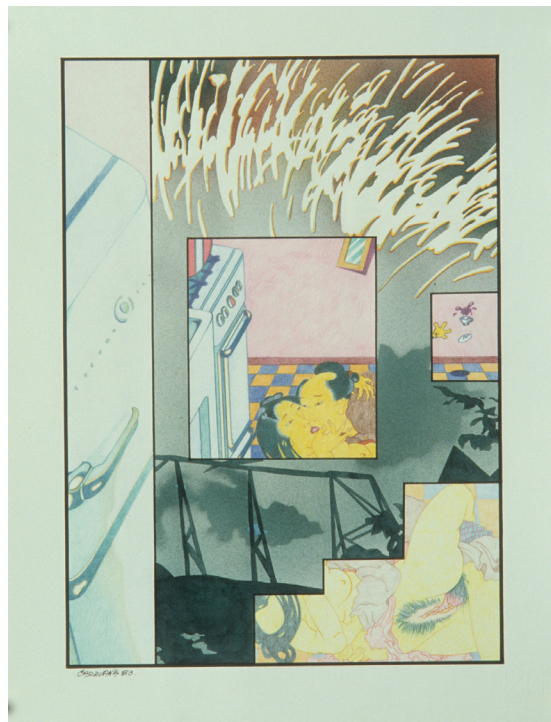
S/T, técnica mixta sobre cartulina, 43 x 33 cm. Jorge Carruana Bances, 1983