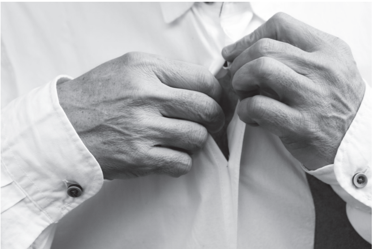
S/T, fotografía digital impresa, 9 x 13 cm. Valle Galera, 2016

Calle San Hermenegildo 28, 28015, Madrid