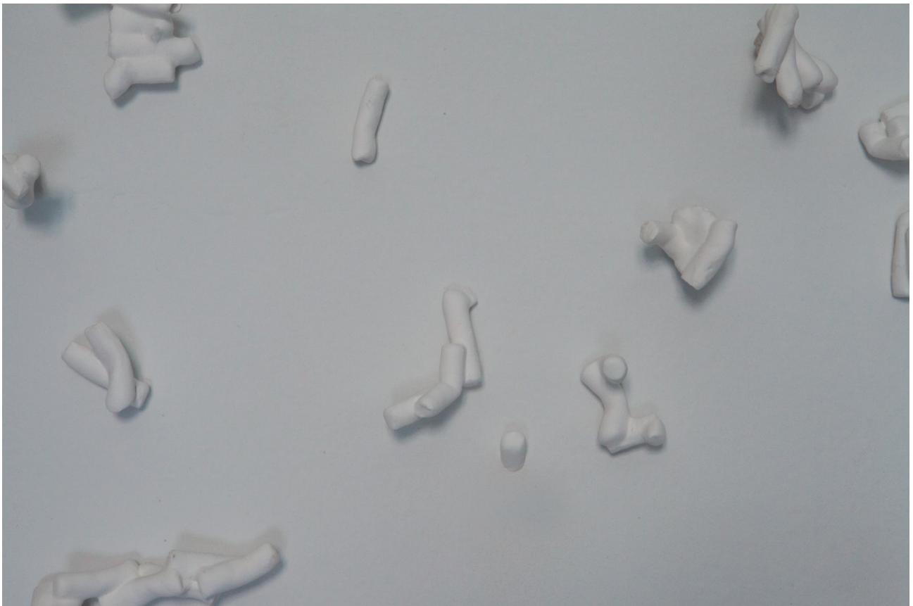
Cigarrillos de porcelana, medidas variables. Valle Galera, 2016

Rastrea una confusa y evocadora generación que ya se adelantó a su tiempo al vivir una sexualidad prohibida en época franquista, hoy también censurada pero ahora por una sociedad que desexualiza a sus ancianos.