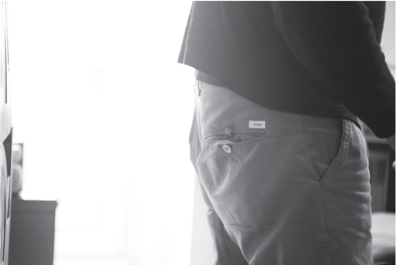
S/T, fotografía digital impresa, 8,5 x 16 cm. Valle Galera, 2016