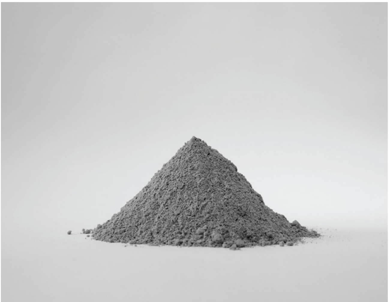
“Ceniza”, fotografía analógica impresa en papel Hahnemühle Baryta FB de 350gr/m2, 20x25 cm, 2013

La muestra se podrá visitar hasta el 5 de julio en el horario de verano de la galería, de miércoles a viernes de 18,00 a 21,00 horas y sábados de 11,30 a 14,00.