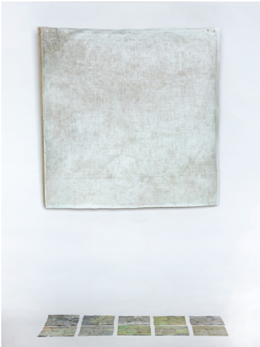
Instalación "Sin título", técnica mixta, 150x200x100 cm, 2014