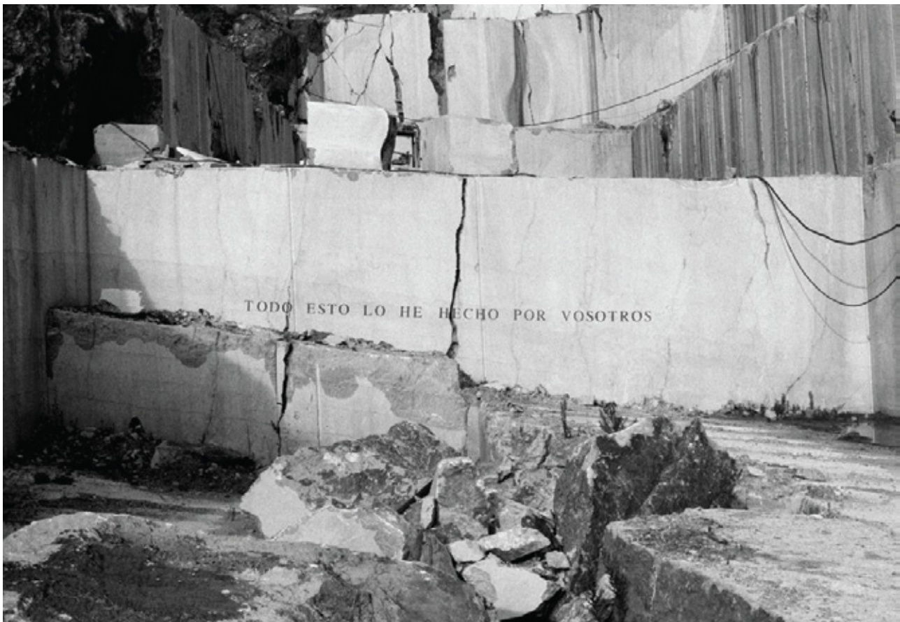
"Sin título", fotografía analógica impresa en papel Hahnemühle Gloss Baryta, de 320gr/m2, 60x80 cm, 2013

Calle San Hermenegildo 28, 28015, Madrid